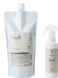
1剤 ラウブ システムトリートメント 1 Retour au Bébé 1 500mL

ヒューマンケラチン分子量200 (特許成分) 配合により、毛髪深部の再構築をします。髪の毛の栄養成分を補いながら保湿して潤いのある髪に。