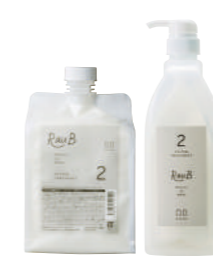
2剤 ラウブ システムトリートメント 2 Retour au Bébé 2 1000g

熱の力により髪の内部に定着し、あらゆる毛髪ダメージを内部補修します。また、内部補修成分を髪から逃さないように表面に皮膜を形成し、フタをします。