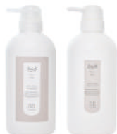
詰替ボトル シャンプー-500mL トリートメント 500g