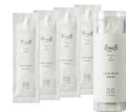
ホームケア ラウブ リッチマスク Retour au Bébé 10g×4

RauBトリートメントの質感を持続させるためのお手入れとして、週に1度のホームケア、RauB リッチマスクをご使用ください。