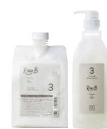
3剤 ラウブ システムトリートメント 3 Retour au Bébé 3 1000g

ハチミツやアルガンオイルなどの天然成分でツヤとうるおいを与えRauB 2で形成した皮膜のフタに鍵をし持続性を保ちます。