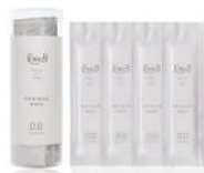
ラウブ ヘアリッチ マスク集中トリートメント 10g×4 包入